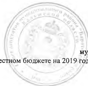
Таблица № 1 к приложению № решения Совета депутатов муниципального района "Барятинский район" "О местном бюджете на 2019 год и на плановый период 2020 и 2021 годов" " 25 " 12 2018 г. 146